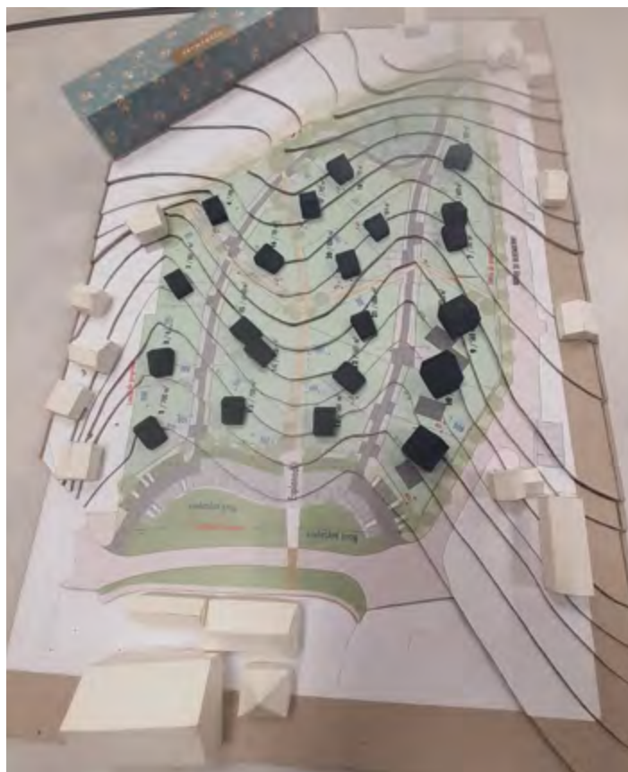
Maquette 3D réalisée par le cabinet d'architectes Thal'Archi