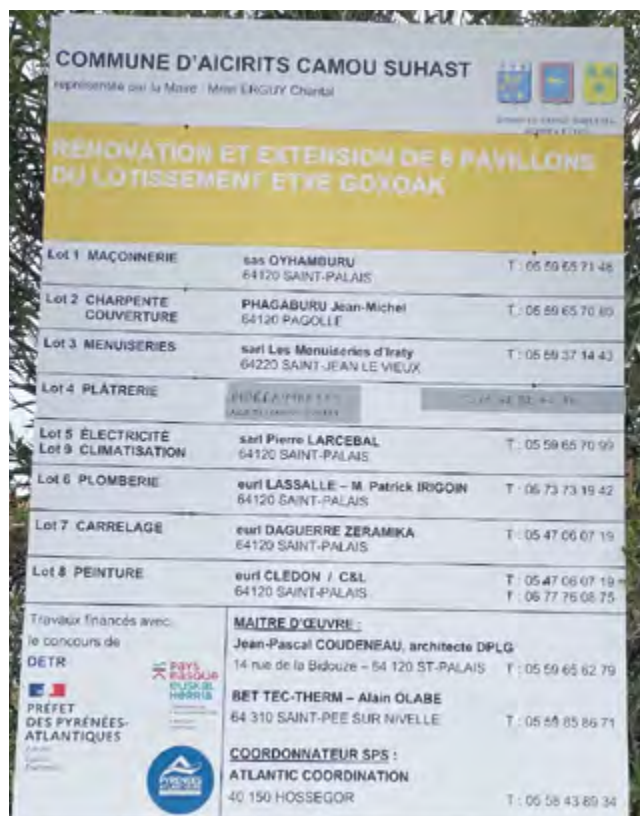
Projet réhabilitation pavillons du CNRO-Etxe Goxoak